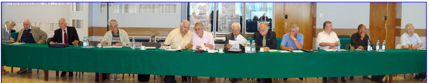
Zgromadzeni na sali obrad Prezesi Zarządów Wojewódzkich SEiRP z całego kraju.